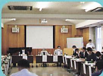
・市内高等学校との意見交換会