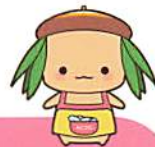
青森中央短大キャラクター 「ちゅっぴい」