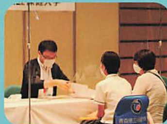
・合同進学説明会