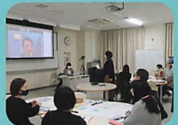
・防災事業（心理的応急処置の講座）